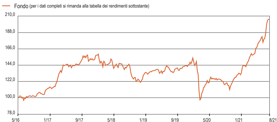
Gráfico Performance ( crescita 100 ) - Da Inizio Gestione: osservazioni settimanali

44, rue de la Vallée L-2661 Luxembourg R.C.S. Luxembourg: B 110 332 Tel. +352 27 726 100 www.casa4funds.com fund-services@casa4funds.com